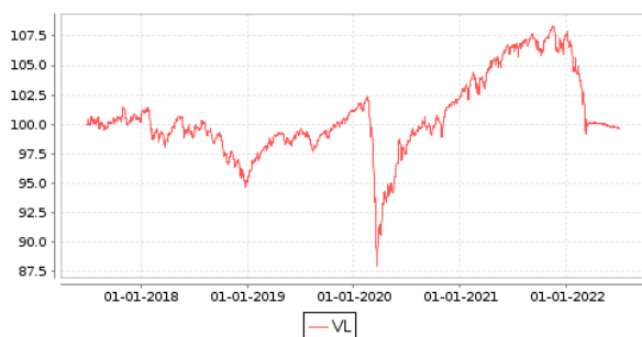
Gráficos evolución valor liquidativo últimos 5 años