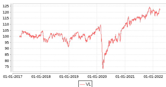
Gráficos evolución valor liquidativo últimos 5 años