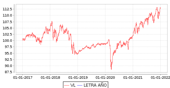
Gráficos evolución valor liquidativo últimos 5 años