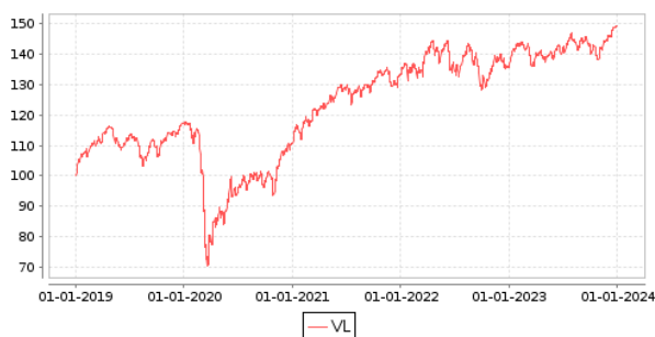
Gráficos evolución valor liquidativo últimos 5 años