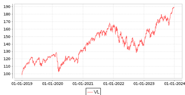
Gráficos evolución valor liquidativo últimos 5 años