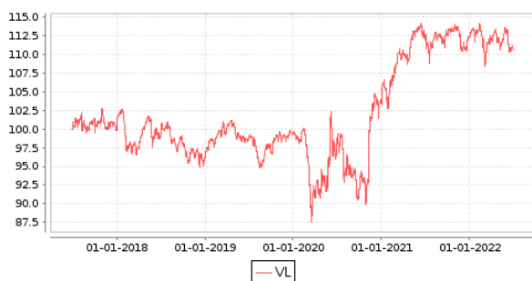
Gráficos evolución valor liquidativo últimos 5 años