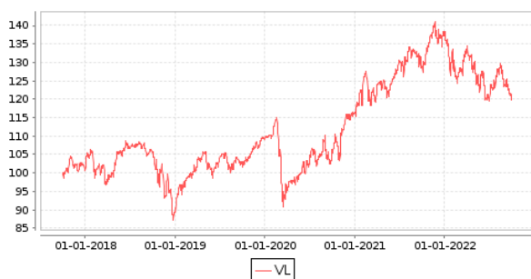
Gráficos evolución valor liquidativo últimos 5 años