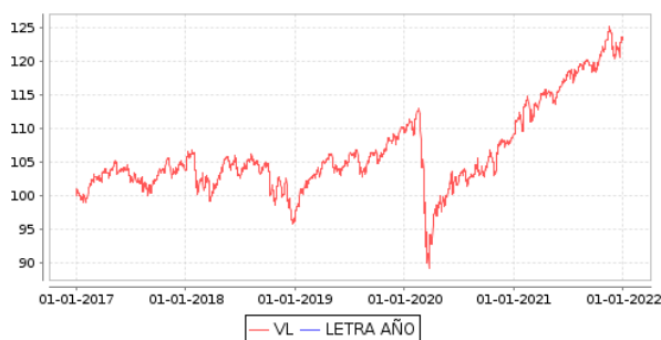
Gráficos evolución valor liquidativo últimos 5 años