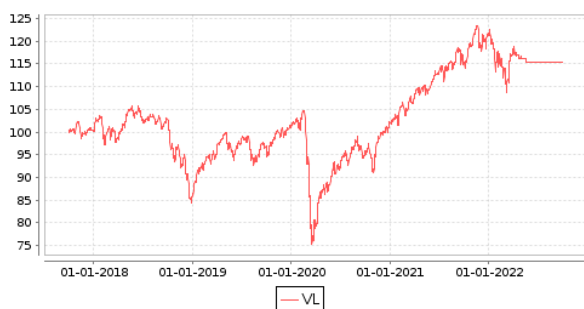
Gráficos evolución valor liquidativo últimos 5 años