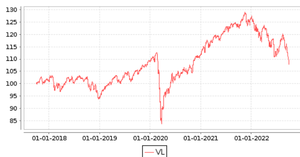
Gráficos evolución valor liquidativo últimos 5 años