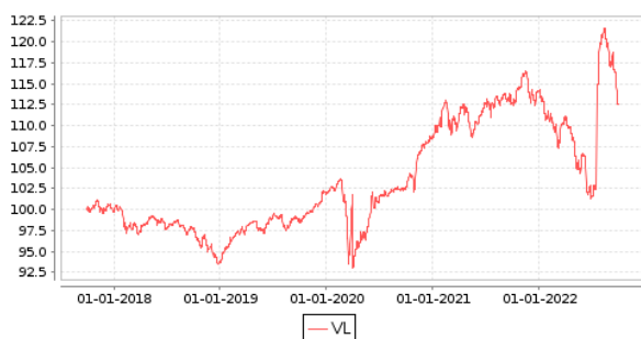
Gráficos evolución valor liquidativo últimos 5 años