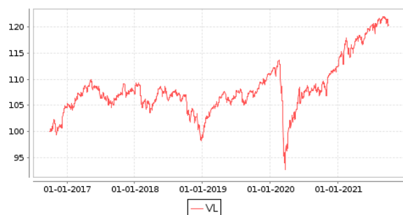
Gráficos evolución valor liquidativo últimos 5 años