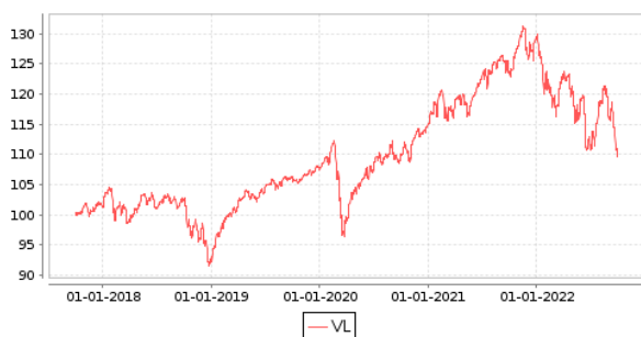
Gráficos evolución valor liquidativo últimos 5 años