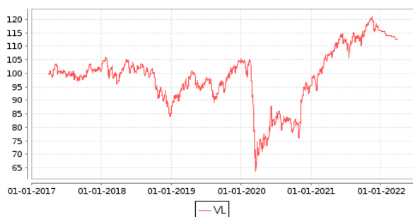
Gráficos evolución valor liquidativo últimos 5 años