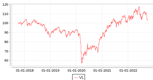
Gráficos evolución valor liquidativo últimos 5 años