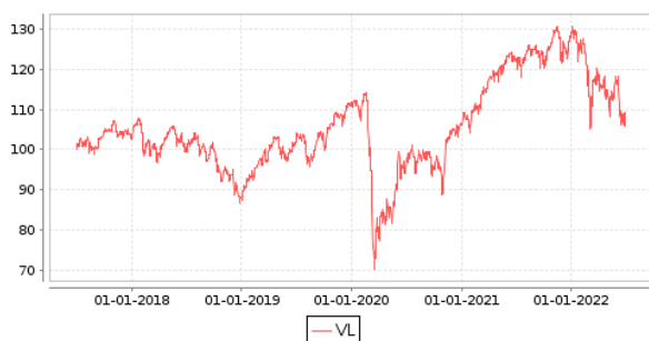
Gráficos evolución valor liquidativo últimos 5 años