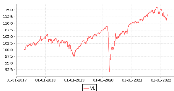
Gráficos evolución valor liquidativo últimos 5 años