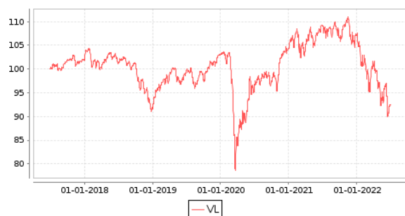
Gráficos evolución valor liquidativo últimos 5 años