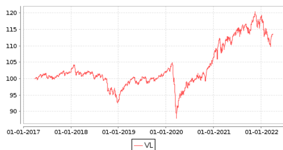
Gráficos evolución valor liquidativo últimos 5 años