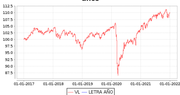
Gráficos evolución valor liquidativo últimos 5 años